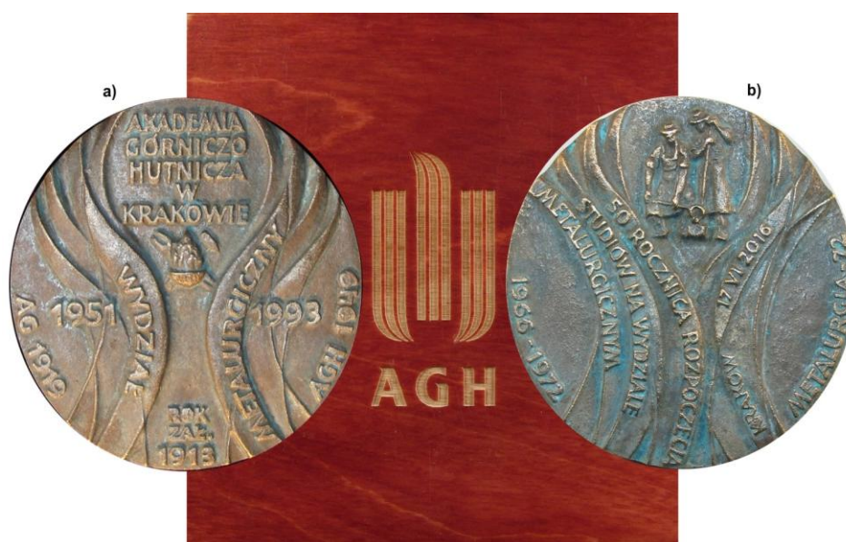
Fot.10. Medal okolicznościowy: awers – po kuciu (a) i rewers – po patynowaniu (b), przygotowany na pamiątkę odnowienia immatrykulacji podczas obchodów 50-lecia rozpoczęcia studiów na Wydz. Metalurgicznym w roku akad. 1966/67. Projekt i wykonanie artysta rzeźbiarz Mariusz Wasilewski – ASP w Krakowie.