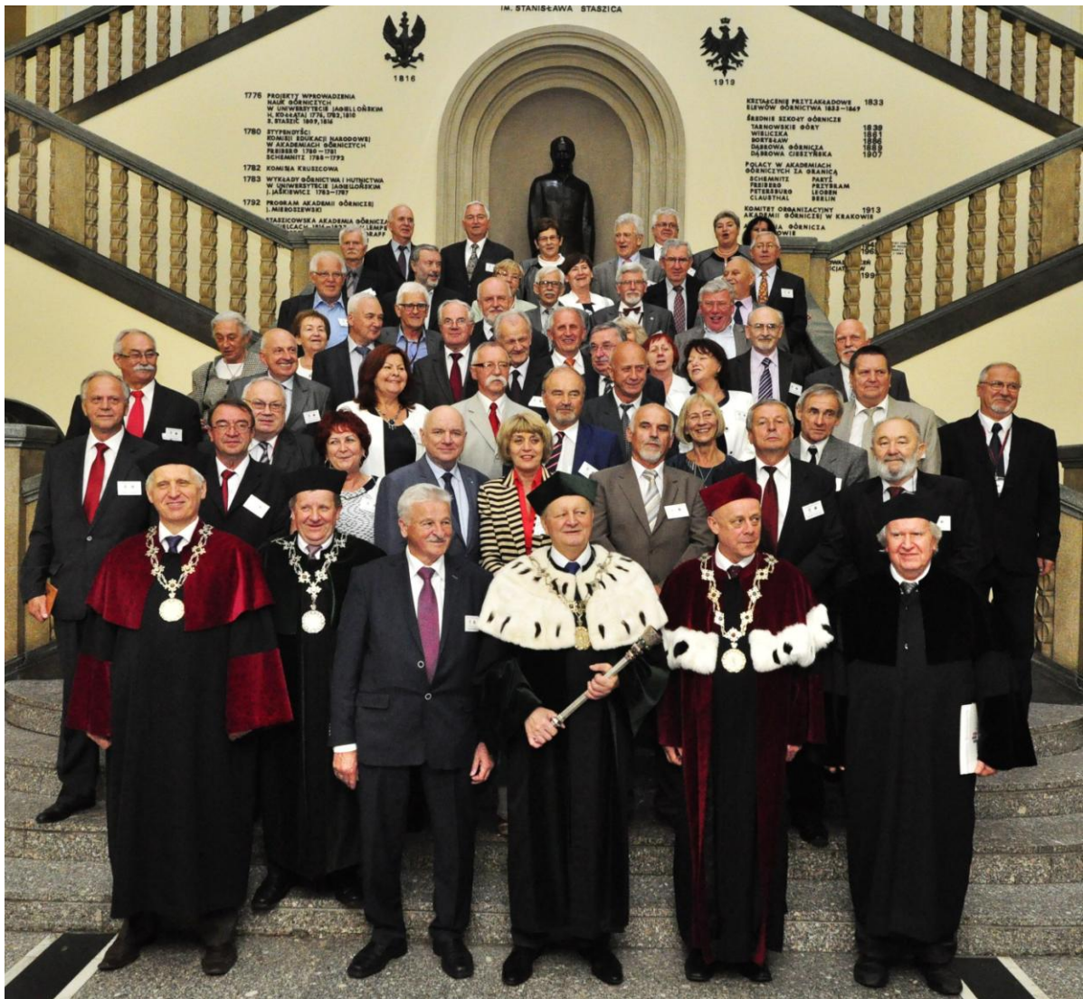
Fot.8. Absolwenci Wydziału Metalurgicznego AGH „METALURGIA'72”, uczestnicy ponownej immatrykulacji po 50. latach od rozpoczęcia studiów w roku akad. 1966/67, podczas obchodów tej rocznicy w murach Alma Mater w dniu 17 czerwca 2016 roku. Stoją (od lewej):