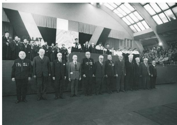
Fot.3. Uczestnicy odnowienia immatrykulacji z okazji: 50-lecia – 31 osób (a), i 60-lecia – 12 osób (b), spośród pierwszych studentów Wydz. Górniczego AG, od rozpoczęcia studiów w Akademii Górniczej w roku akad. 1919/20. Hala Sportowa T.S. „Wisła”, 21 maja 1969 r. (a) i 20 października 1979 r. (b).