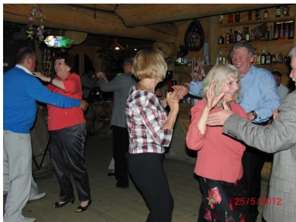
Fot.17. Miejsce naszego wieczornego spotkania i całonocnej balangi podczas zjazdu. Zakopane, 25.05.2012