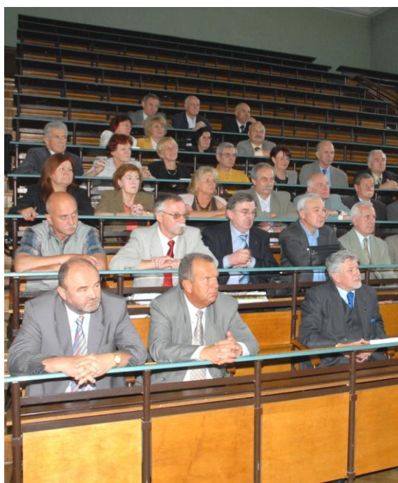
Fot.11. Spotkanie zjazdowe na uczelni w Audytorium prof. W. Leskiewicza podczas zjazdu z okazji 35-lecia. AGH Kraków, 01.06.2007 r.

Zjazd ten zorganizowano po raz ostatni jako dwuczłonowy: najpierw spotkanie na AGH, a po nim wyjazd do atrakcyjnego ośrodka wypoczynkowego, w którym organizowano uroczystą kolację i inne atrakcje zjazdowe.