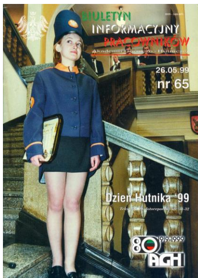
Rys.4. Okładka Biuletynu Informacyjnego Pracowników AGH – 26.05.1999