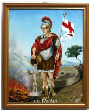
Rys.1. Św. Florian

Dzień Hutnika jest tradycyjnym świętem ludzi przemysłów metalurgicznego, głębokiego przetwórstwa i innych, związanych z nim gałęzi, skupionych wokół procesu produkcji tego uniwersalnego tworzywa, jakim jest stal. Święto to jest zwyczajem, który gloryfikuje znaczenie zawodu hutnika, podkreśla jego godność i daje okazję do kontaktu zaprzyjaźnionych i bliskich sobie osób. Obecnie istnieje wyraźne rozdzielenie hutnictwa i górnictwa, zrozumiałe ze względu na technikę i organizację pracy.