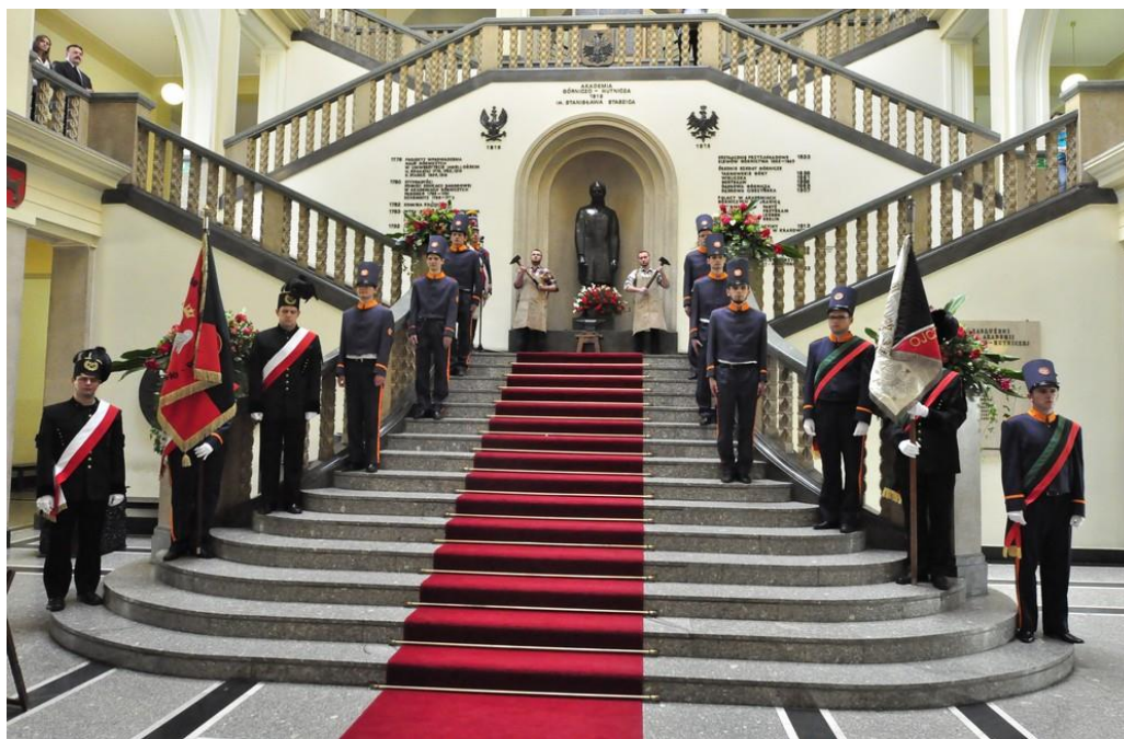
Rys.3. Ceremonia Ślubowania Hutniczego w Dniu Hutnika'2014 na krużgankach w paw. A-0. Stoją na schodach (od lewej, w górę): asysta pocztu sztandarowego AGH, kosciarze, pudlerz (zasłonięty), kowale, kosciarze, asysta pocztu sztandarowego Stowarzyszenia Wychowanków AGH.

Młodzież polska, studiując w zagranicznych ośrodkach naukowych, przyswajała sobie miejscowe tradycje organizacji studenckich, przenosząc je później na teren uczelni krajowych, m.in. Akademii Górniczej w Krakowie. Przed wojną każdy student był skokiem przez skórę pasowany na górnika czy hutnika. Dzisiaj jedynie wybrana, nieliczna grupa wyróżnionych studentów dostępuje zaszczytu osobistego uczestniczenia w skoku przez skórę lub ślubowaniu hutniczym. Idea odrębnego obyczaju przyjmowania do stanu hutniczego pojawiła się w 1962 r. Po raz pierwszy w Uczelni zorganizowano Dzień Hutnika, połączony z uroczystym ceremoniałem Ślubowania Hutniczego (rys.3) wraz z tradycyjnym spotkaniem towarzyskim w Karczmie pod Kadzią. Jednocześnie w całym przemyśle hutniczym w Polsce wprowadzono flagi hutnicze w kolorze czarno-czerwonym oraz godło hutnicze. Jako nowy element pojawiła się tradycja wykonywania kufli, tac i innych upominków z motywami, upamiętniającymi dane święto i wspólnie spędzone chwile Starych Strzech i Młodych Hutników.